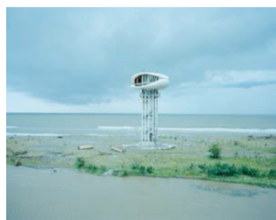
"Anaklia, Georgien", 2013.

1 Det vilar något både oskuldsfullt och kaxigt över Malin Gabriella Nordins måleri. Solstrålar och blomblad virvlar runt på dukarna i självlysande toner av apelsin, citron och pion. Hon ber ingen om ursäkt när hon bejakar fantasins och sagans landskap. I likhet med det tidiga 1900-talets expressionister och fauvister – tänk en André Derain eller Sigrid Hjertén – koncentrerar hon sig på ytan som fylls av svingande mönster, silhuetter och växtlighet. Född i slutet av 1980-talet går hon sin egen väg inom nutida måleri. Trots den flödande kolorismen och det naivistiska anslaget finns inget insmickrande över hennes arbete. Konsekvent skapar hon sitt eget form- och färgalfabet som bottnar i närmast urtida symboler, likt blomman, fågeln, solen och jungfrun. Blir färgprakten alltför uppfordrande går det fint att hejda sig inför de rytmiska linjerna i hennes mer grafiska bilder. Utställningen på Kristianstads konsthall är hennes största hittills, där hon förutom måleri på duk, kakel och silke även visar videoverk, skissböcker, kollage och en monumental skulptur.